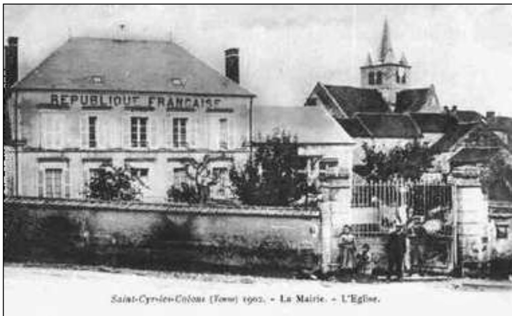
Saint-Cyprien-Créhoux (France) 1902. - La Mairie. - L'Eglise.

Au jour de l'an, les jours croissent d'un vol de faisan